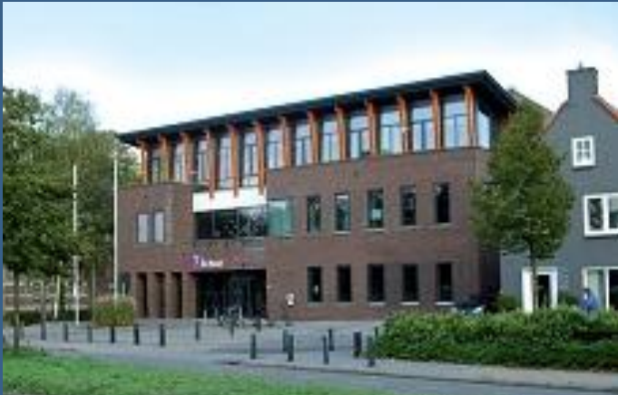
EMC de Raad Raadhuisstraat 22 7001 EW Doetinchem